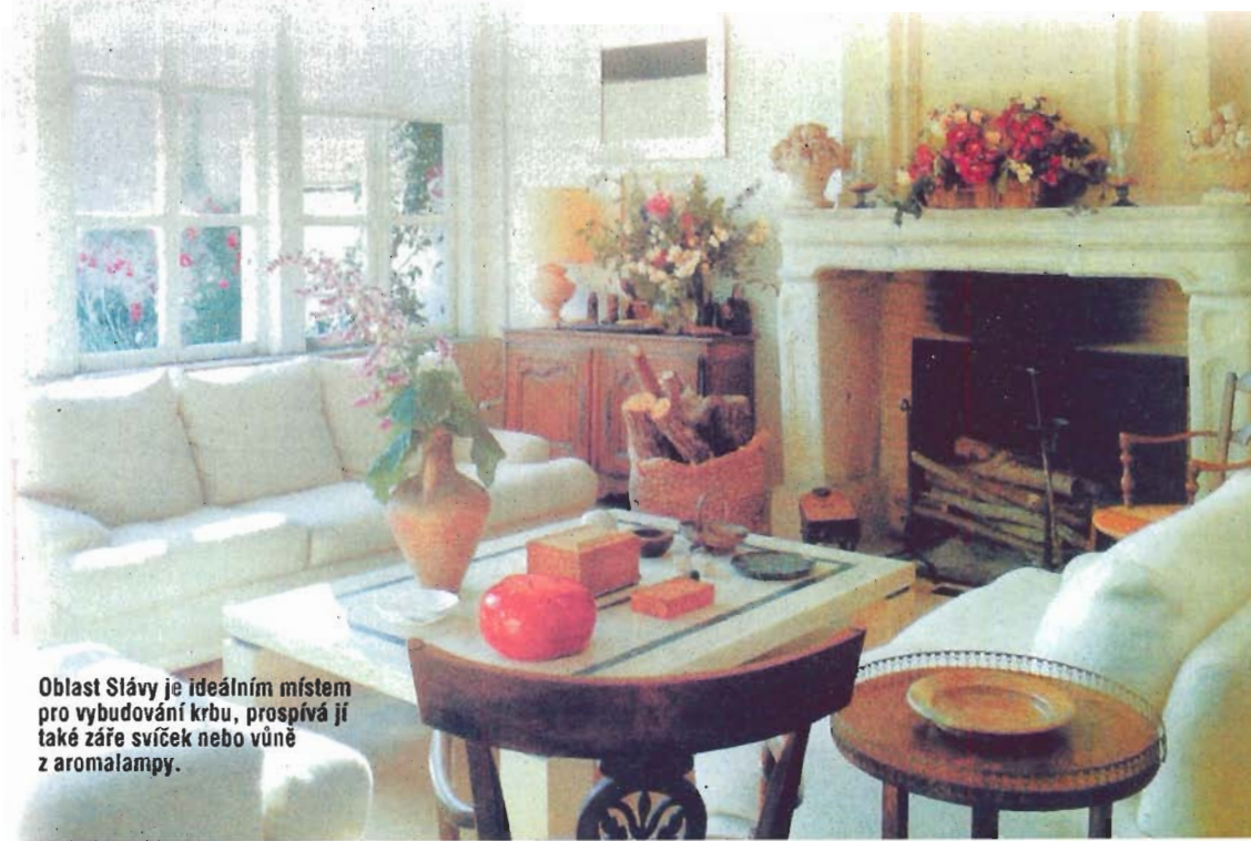
Oblast Slávy je ideálním místem pro vybudování krbu, prospívá jí také záře svíček nebo vůně z aromalampy.